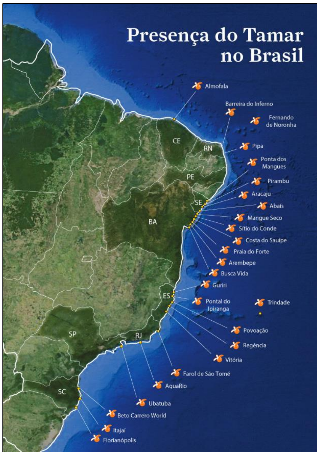
Figura 3 Mapa das Bases TAMAR