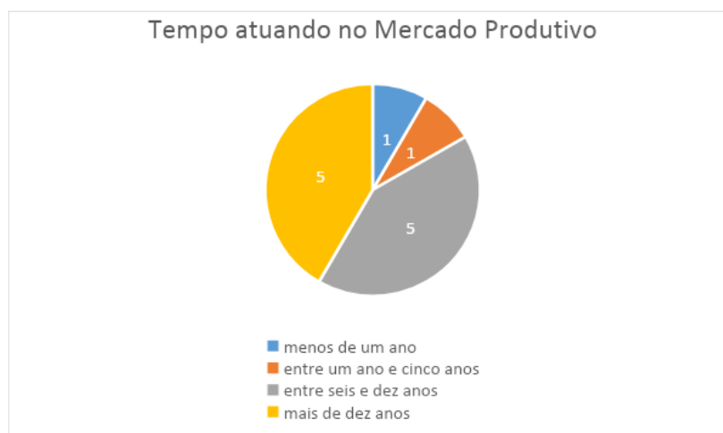
Gráfico 3: Tempo atuando no Mercado Produtivo

Entre todos os professores entrevistados, quatro lecionam concomitantemente em outras escolas, sendo que dois lecionam também em faculdades. Sete professores dentre os entrevistados lecionam apenas na unidade escolar.